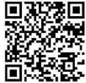
Akademische Mittagspause (youtube)

Die Resonanz auf die 70 Vorträge hat uns gezeigt, wie groß das Interesse von Stadt und Universität daran ist, dass wir Juristen Einblick in unsere Arbeit geben. Vor allem haben diese Vorträge unsere Fakultät immer wieder zusammengeführt – als eine interessierte und interessante Rechtsgemeinschaft. Inzwischen sind zahlreiche Vorträge auf youtube veröffentlicht (siehe nebenstehender QR-Code). Demnächst folgen noch ausführliche Publikationen in der (ebenfalls frei im Netz zugänglichen) „kleinen Reihe“ der Fakultät, den Miscellanea Juridica Heidelbergensia ( www.jura.uni-heidelberg.de/mjh/ ). Schauen Sie hinein!